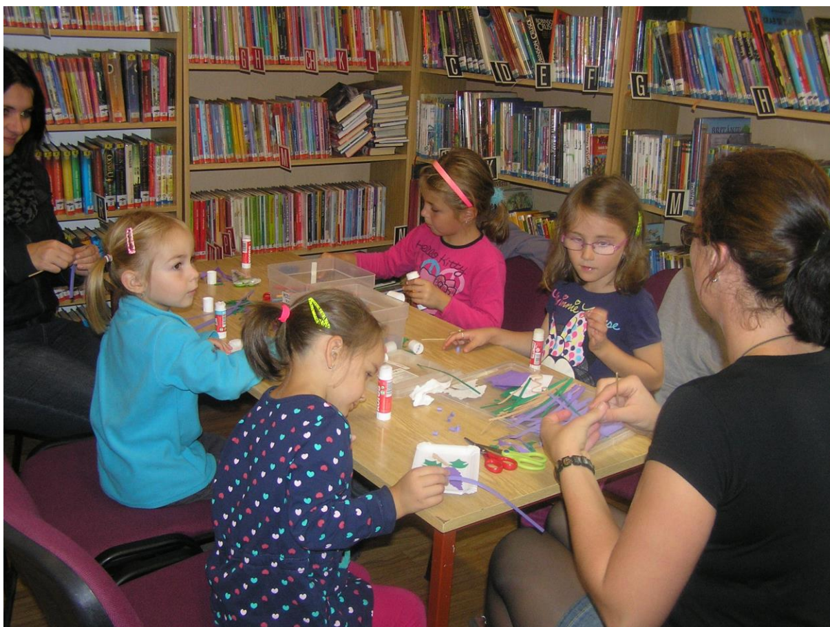
Podzimní výtvarná dílna pro děti

Adresa: Městská knihovna Rтынě v Podkrkonoší nám. Horníků 440